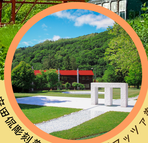
安田侃彫刻美術館 アルテピアッツァ美唄