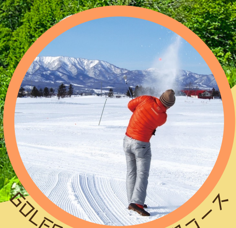
GOLF5カントリー美唄コース and more...